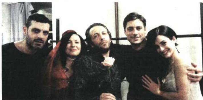
Екипът на „Рибарят и неговата душа“ след представление 200 в Театър 199