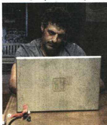
В технологичния свят на „Вездещият“ хوليوудска машина влезете в нашата малко по-светичка и по-бедничка?

- Не малко, много по-бедна и свита. Има, разбира се. Но иначе бих изгубил връзка с реалността, а е важно човек да я има. Например във всеки американски филм, в който съм снимал, съм имал собствена каравана. За българските филми това е нещо немислимо, забравено е като вариант. Има хора, които правят българско кино и не знаят за това нещо. И всичко е от бедността, от свиване на бюджет. Разликата е голяма, но като обгрижване. Иначе работата си е работа. Актьорите са еднакви навсякъде.