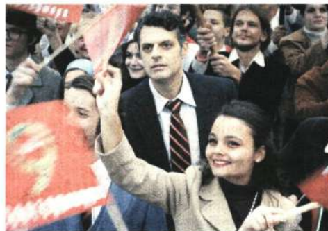
Минеш ли портала, попадеш на манифестация през 1979 г.